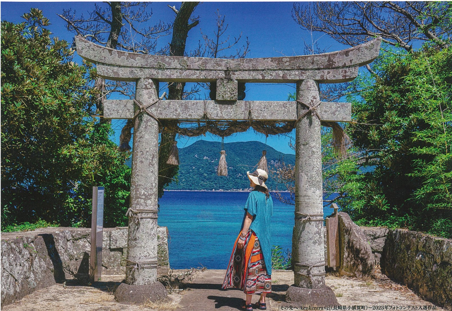
「その先へ」kenkentavel(長崎県小値賀町)〜2023年フォトコンテスト入選作品

失ったら二度と取り戻せない日本の農山漁村の景観と文化。日本の原風景。 あなたの写真・動画の力で、後世に残しませんか。