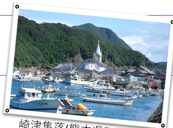
崎津集落(熊本県天草市)