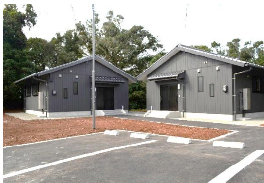
木場地区定住促進住宅