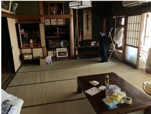
1 階 和室①