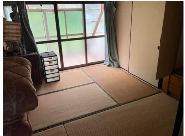
1 階 和室②