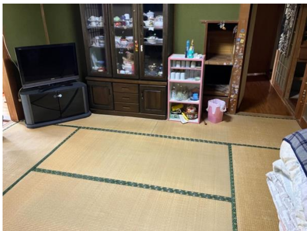
1 階 居間