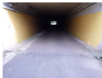
トンネル坑内(起点側→終点側)