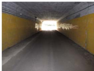
トンネル坑内(起点側→終点側)