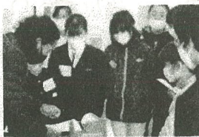
【イングリッシュデー】

5・6年生は中学生と一緒にアメリカやカナダの方とリモートで話したりALTと交流したりしました。外国との時差を感じたり、英語の楽しさを感じたりとすばらしい学習の機会になりました。