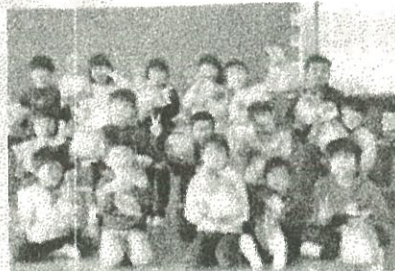
【クリスマスプレゼント】

5・6年生は中学生と一緒にアメリカやカナダの方とリモートで話したりALTと交流したりしました。外国との時差を感じたり、英語の楽しさを感じたりとすばらしい学習の機会になりました。