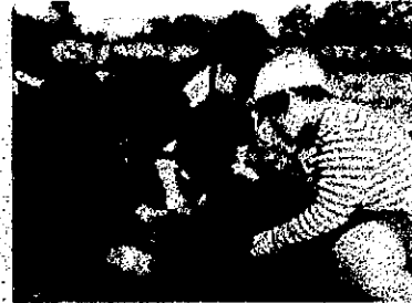
【いもほり】担い手公社さんにお世話をいただき、6年生と1年生と一緒にいもほりを楽しみました。