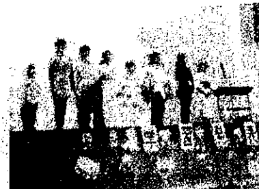
【分校学習発表会】お話しやオペレッタなど、8名が力を合わせて日ごろのがんばりを発表しました。