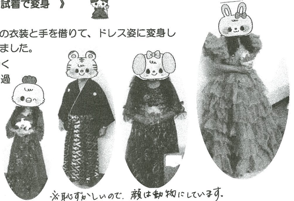
※恥ずかしいので、顔は動物にしています。実物はもっとかわいいです。