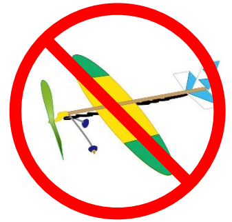
模型航空機の飛行