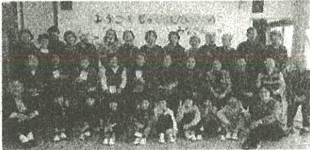
《1年生「熟年大学」との交流会》

熟年大学の皆さんをお招きし、昔遊びなどを一緒に楽しみました。給食も一緒に食べました。