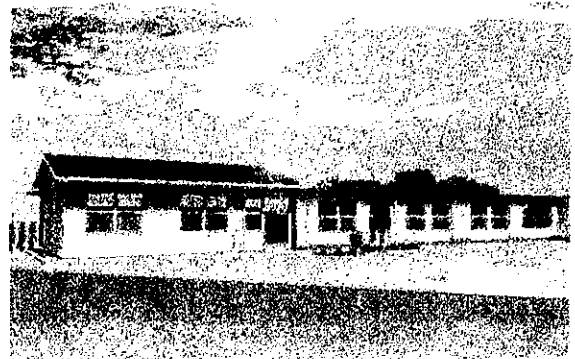
増築校舎イメージ