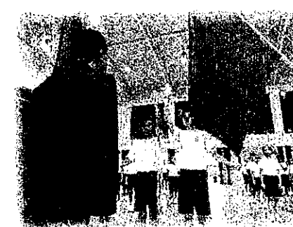
中高合同の選手宣誓