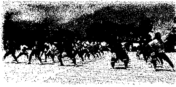
赤ブロックの応援