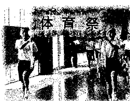
大会プラカードの入場