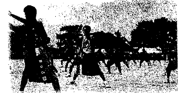
青ブロックの応援