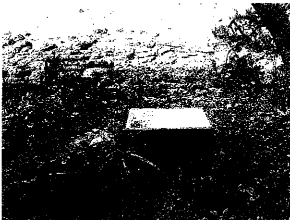
赤色の小型冷蔵庫（7/7 海岸清掃時発見）