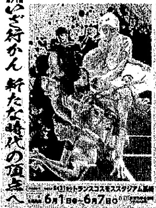
いざ行かん 新たな時代の頂点へ