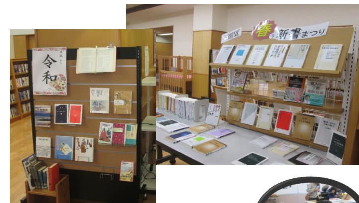
待ってる間、展示した本を読書中！→