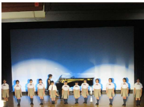
町民文化祭当日の様子