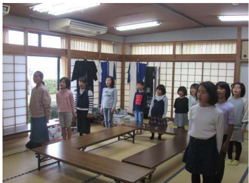
取材時の練習風景