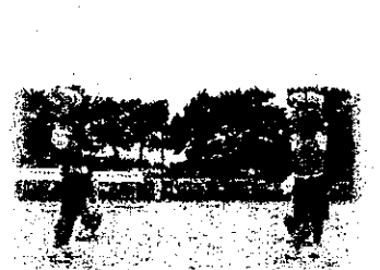
ハッスルマッスル