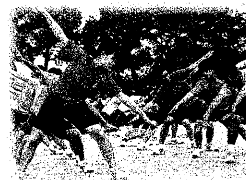
赤ブロックの応援