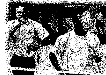
サバイバルレース