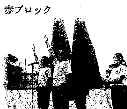
中高合同の選手宣誓