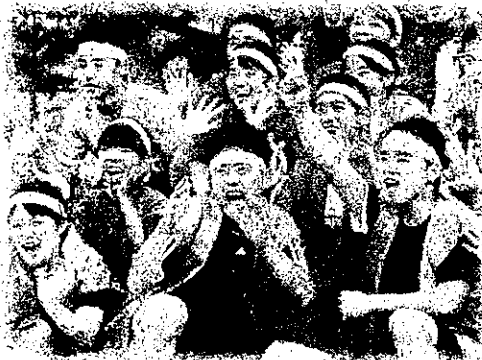
青ブロックの応援