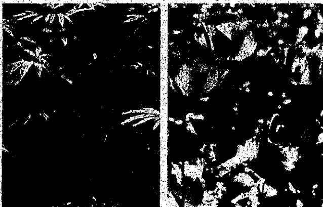
植えてはいけないけしの一例↑↑