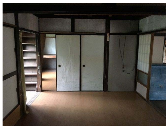
1階 北側フローリング