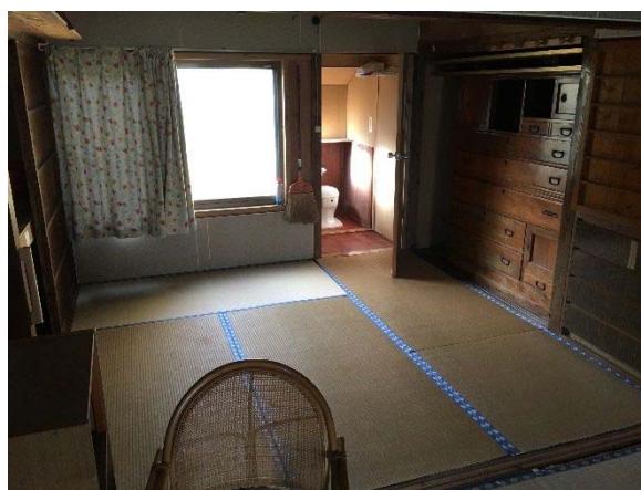
1階 北側和室・トイレ