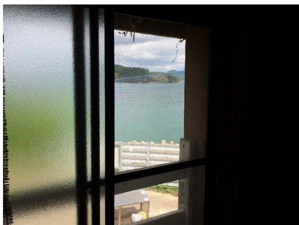
2階 窓から海が見える