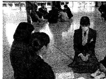
トレジャーハントの出来は？