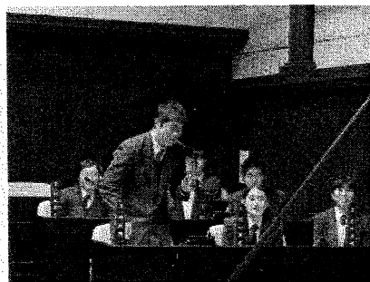
質疑に答えています