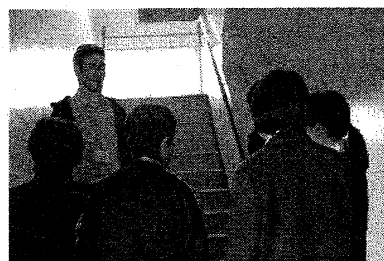
How are you?