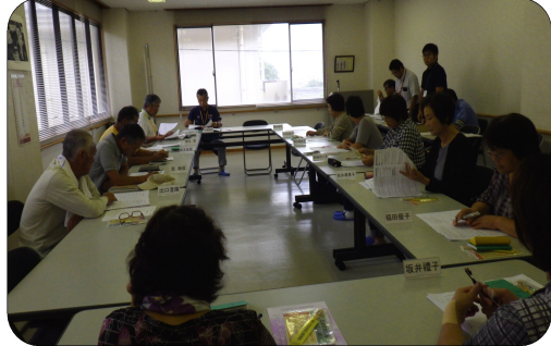
(民生委員の皆さん)

9月22日(金)民生委員・児童委員9月定例会に出席し、民生委員の皆さんを対象に悪質な電話勧誘販売による消費者被害防止を図る目的で、県より配布される「自動通話録音装置」の説明をしました。各地区で高齢者を対象に取り付け対象世帯を調べていただくようお願いしました。