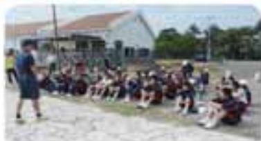
船瀬は、小学生高学年の児童と中学1年生、高校2年生が担当しました。