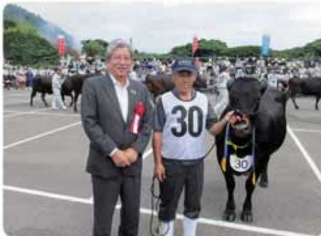
小値賀町初の選考に西町長も興奮

第11回目となる全共は、今年9月7日から11日にかけて仙台市食肉市場で開催されます。関係者にとって熱い夏が訪れそうです。