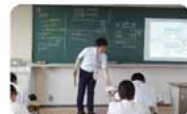
高校日本史の公開授業

10月には研究授業ウィークスの開催を予定しております。今後とも、小中高一貫教育にご理解ご協力のほどよろしくお願いいたします。