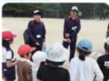
小学生低学年の児童と高校1年生が班で清掃に取り組みました。