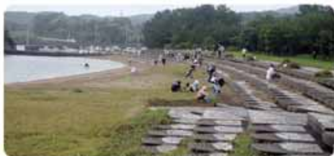
多数のご参加ありがとうございました

7月9日(日)町民約750名が参加して町内一斉海岸清掃が行われました。梅雨空の下、各地区の海岸や海水浴場、港のごみ拾いや草刈などのボランティア作業が行われました。