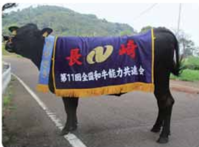
全国大会優勝をめざして頑張ってください！