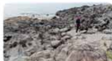
岩場が見違えるようにきれいになりました。