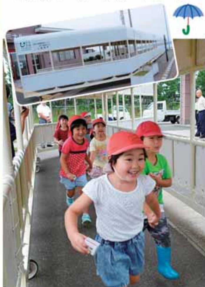
渡り初めする子どもたち