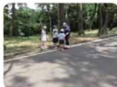
仲良く、一生懸命掃除をしていました。