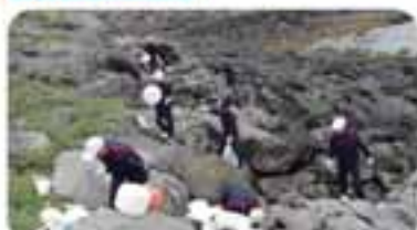
浜崎島では、中学3年生と高校3年生が清掃活動にあたりました。