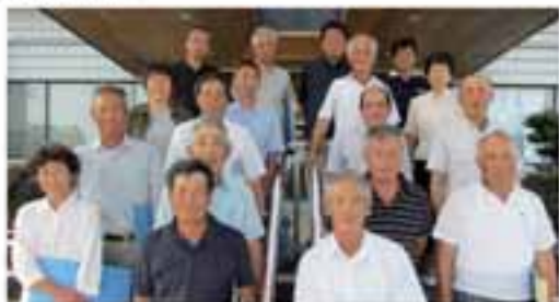
3年間よろしくお願ひします

平成29年7月20日から3年間、下記の方々が農業委員及び農地利用最適化推進委員として任命されました。 農地の問題等でわからないことがあれば、ご相談ください。