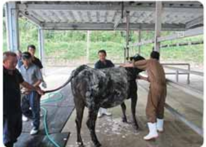
小値賀の牛仲間と丁寧な磨かれます