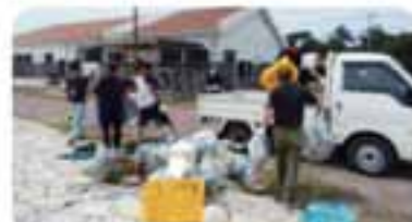
たくさんのごみを回収することができました。