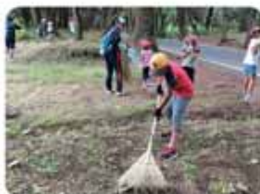
小値賀の名所の一つである「姫の松原」付近の清掃を行いました。