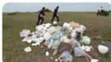
トラック何台分ものごみを回収することができました。