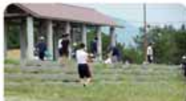
手分けして、ごみを回収していききました。