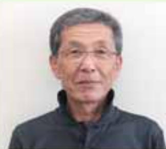
よろしくお願いします