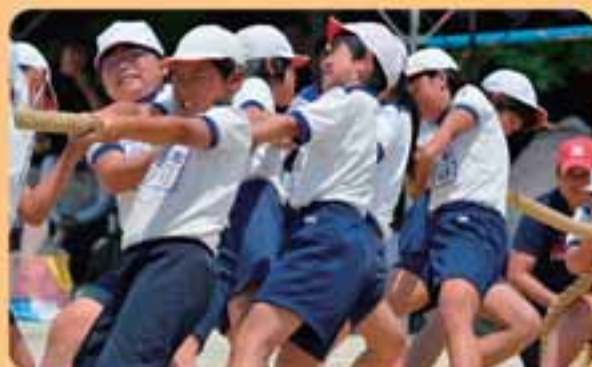
みんなで力をあわせて綱引き対決