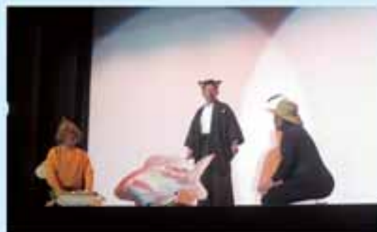
とんとによる児童劇「ハチとアリ」