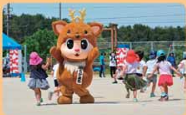
ちかまるくんも運動会に飛び入り出場