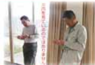
お言葉に尽きるのでもう一人