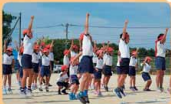
元気いっぱいの応援対決

5月21日（日）、小学校運動場で平成29年度小値賀小学校運動会が行われました。透き通るような青空の下、83名の元気な子ども達の声が島中に響き渡り、番岳のカラスやトンビもびっくりしたのではないのでしょうか。