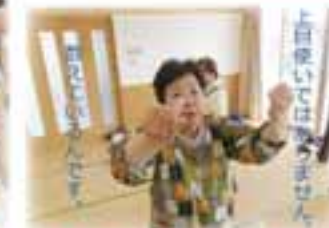
上自慢ではあません