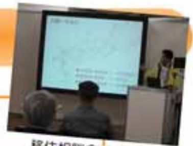
移住相談会のようす