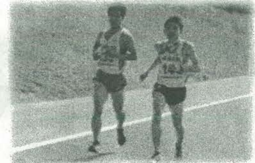
次のランナーへ繋ぐ