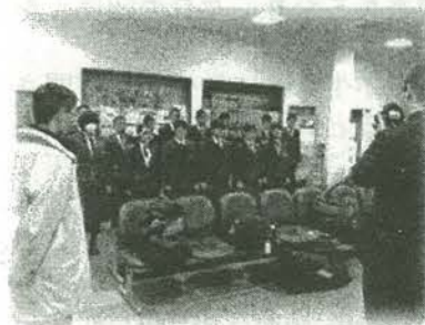
小値賀港にて出発式