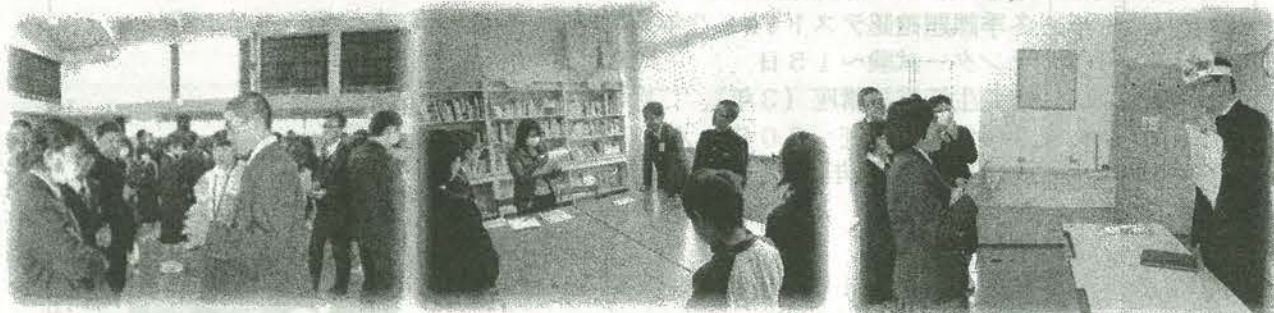
なかま集めゲーム

12月19日(月)本校において、小中高一貫教育の一つとして英語科による、小値賀小学校5・6年生、小値賀中学校全校生徒、北松西高校全生徒を対象に English Day が実施されました。なかま集めゲーム、Pokemon Go の企画を校種間を超えてお互いを理解しながら協力して取り組んでいました。