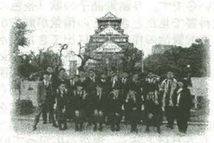
大坂城で記念写真