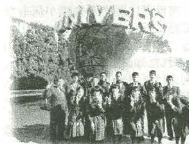
ユニバーサルスタジオジャパンにて