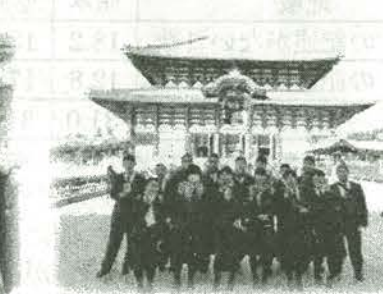
東大寺大仏殿の前で