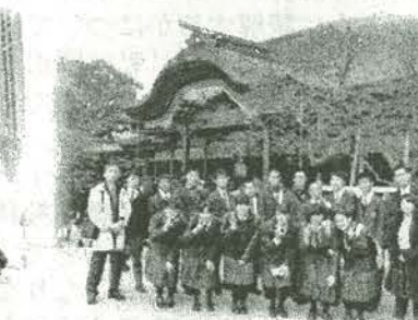
大宰府天満宮にて