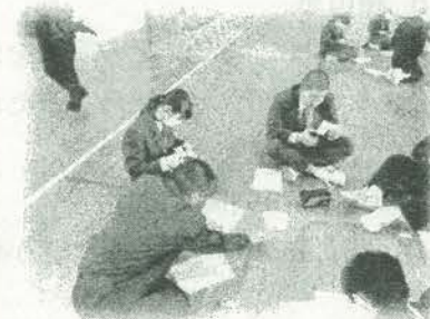
ダイヤモンドランキングシート作り