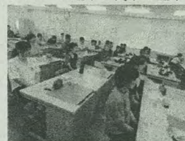
熱心に聞き入っています