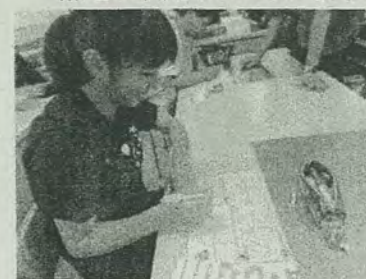
私の食事はどうか？