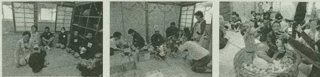
おしゃべり・ふれあいタイム

10月19日（水）1年生を対象に乳幼児および保護者とのふれあい体感活動を行いました。これは乳幼児に対する愛着の感情を醸成し、親の役割の重要性を認識させることを目的とするものです。自己紹介の後、アイスブレイキング、ふれあいタイム、おしゃべりタイム等を実施しました。