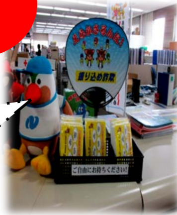
【役場住民課窓口付近】

※ 詳しいことは、役場 産業振興課 (56-3111) 消費生活相談(えらかさるんな)窓口まで