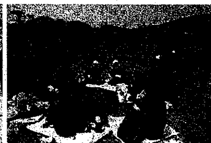
小中高一緒にお昼ごはん