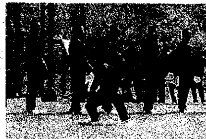
1年男子のパフォーマンス