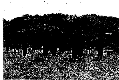
1年女子のパフォーマンス