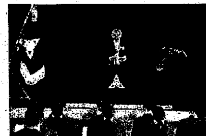
校長式辞を聞く新入生