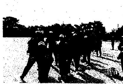
小学校を出発する1年生

今年は天候にも恵まれ、生徒は小学生や中学生とふれあい、レクリエーションではジャンケン列車やサッカーなど楽しんでいました。最後は、全員で記念写真を撮影しました。