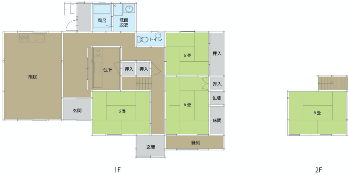
定住促進住宅 木場 間取り図